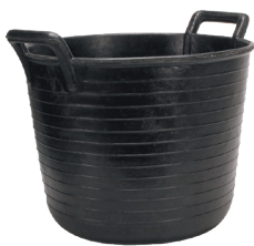
ESPUERTA CESTO CAUCHO N°99 (33 l) REF.88804