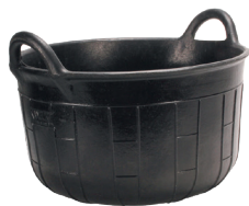
CARBONERA CESTO CAUCHO N°1 (26 l) REF.88902